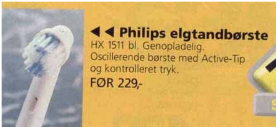
De har fand'ne også sådan en dårlig ånde!