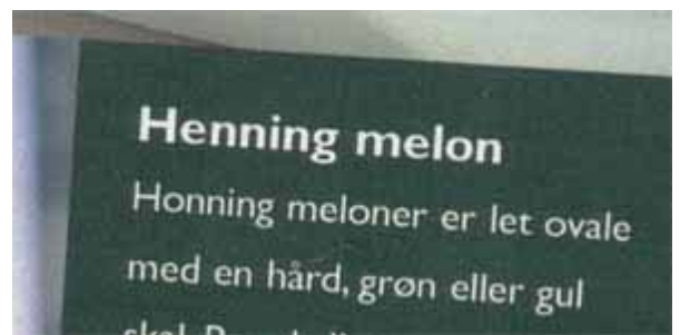
Det er ikke altid fedt at være skaldet...