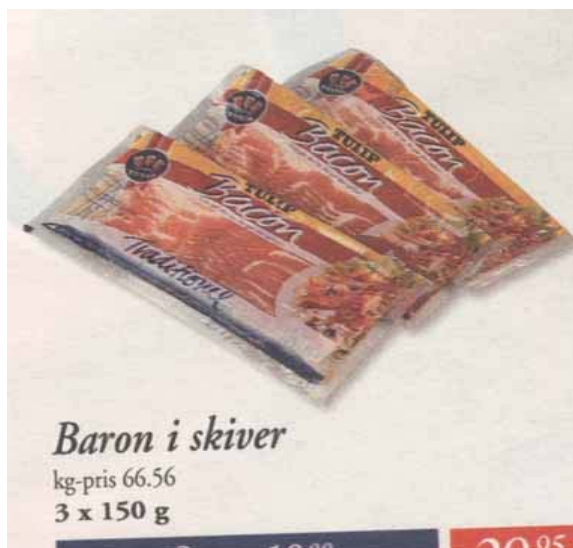
I næste uge: Greve i tern.