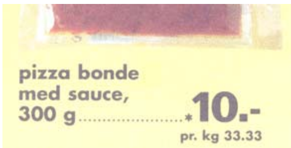
Sicilianer ragout er nu heller ikke at kimse ad...