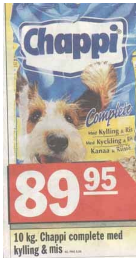
De køtere er så kræsne!